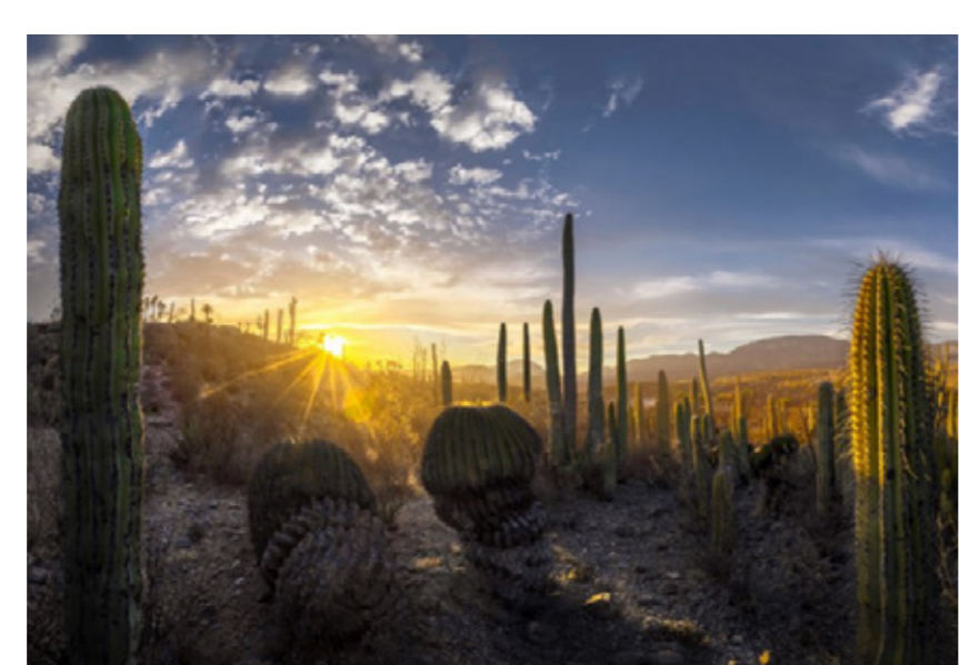
ACUARIO CONABIO Asegurando el Patrimonio Natural Febrero - marzo 2025

GALERÍAS ACUARIO, GRUTAS Y GANDHI ABIERTAS LAS 24 HORAS, GALERÍA JUVENTUD HEROICA ABIERTA DE 6 A 18 HORAS