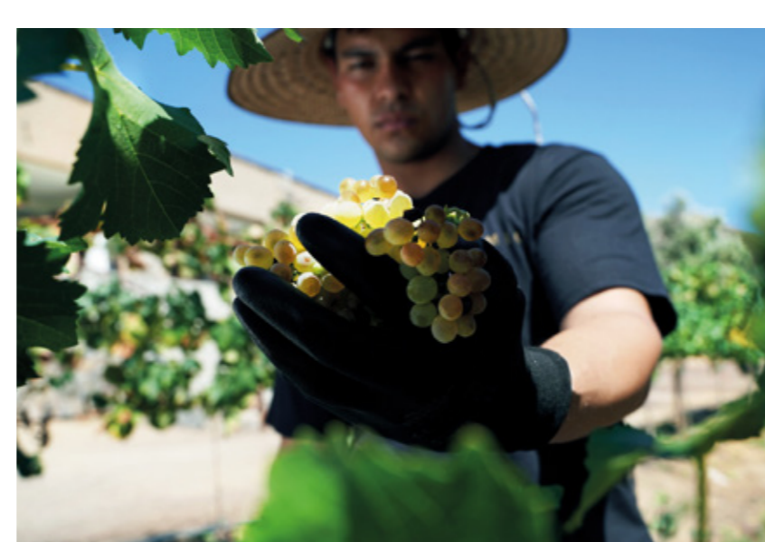
GRUTAS Entre las vides de México Febrero 2025