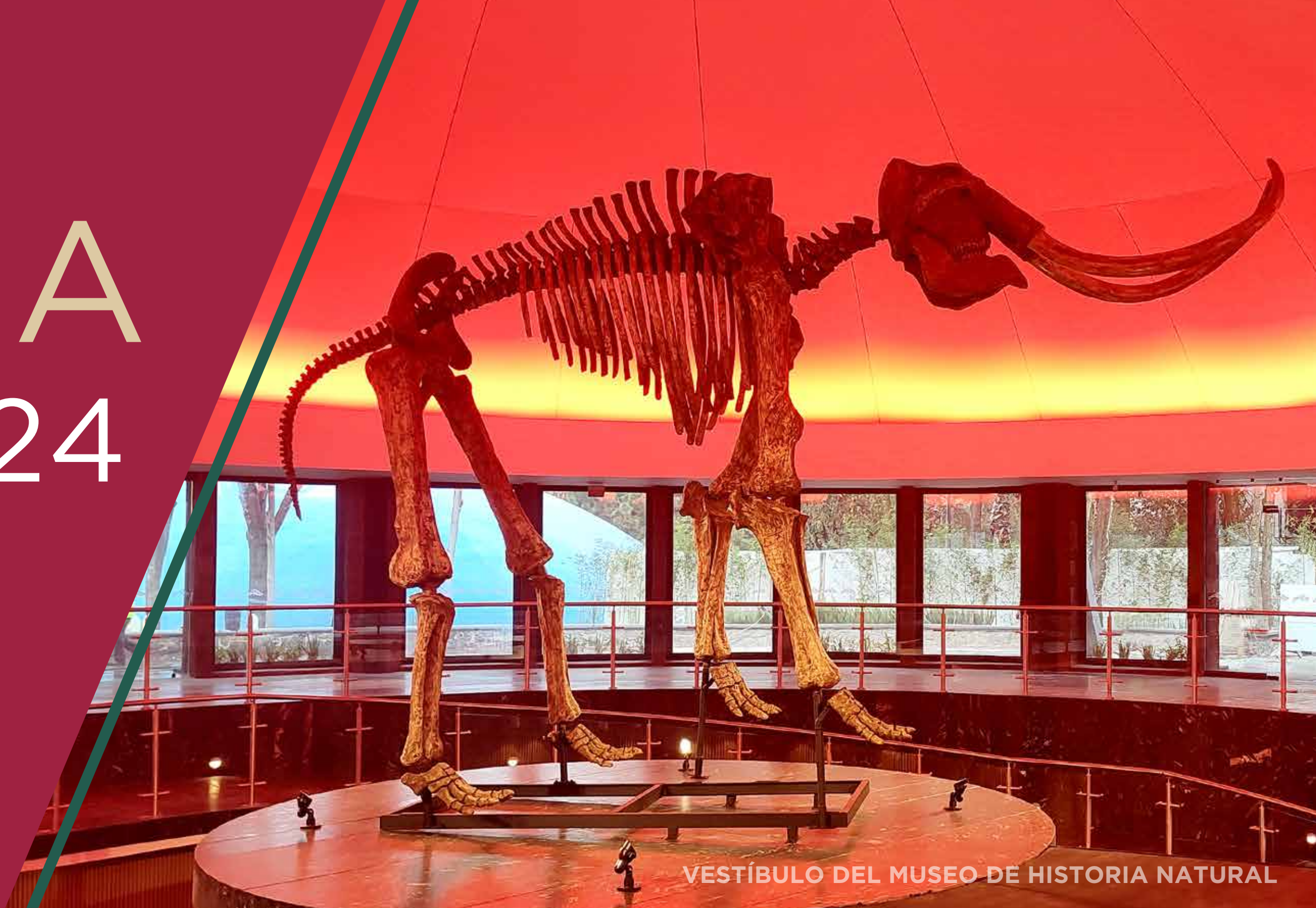
VESTÍBULO DEL MUSEO DE HISTORIA NATURAL

MUSEO DE HISTORIA NATURAL Y CULTURA AMBIENTAL