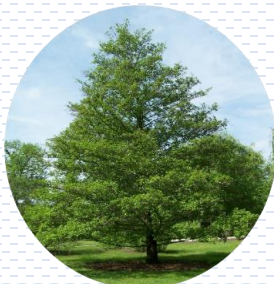
Aile Ainus acuminata APROBADA