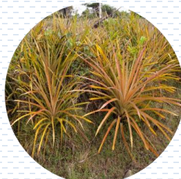
Bromelia Bromelia pinguin L. PROPUESTA Densidad: 5 pzas x 1 m 2