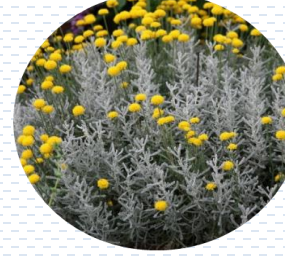
Santolina Santolina chamaecyparissus PROPUESTA Densidad: 16 pzas x 1 m 2