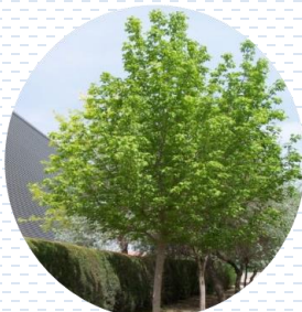
Acer Acer negundo APROBADA