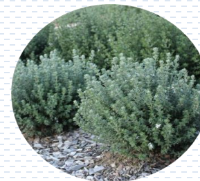
Falso romero Westringia fruticosa PROPUESTA Densidad: 12 pzas x 1 m 2