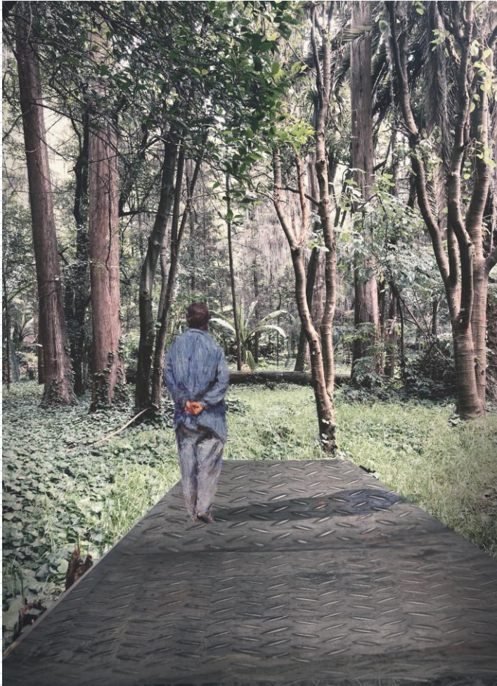
Manantial Ermita Vasco de Quiroga