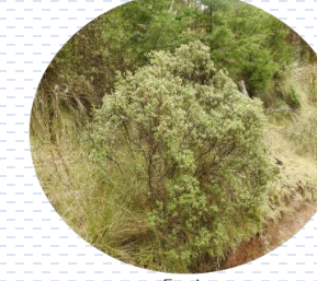
Escoba Baccharis conferta APROBADA Densidad: 1 pza x 3 m 2