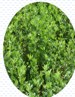
Alfalfa Medicago sativa PROPUESTA Densidad: por semilla 1.5 gr x 1 m 2