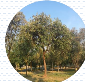
Tepozán Buddleja cordata APROBADA