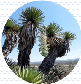
Yuca Yucca filifera APROBADA