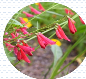
Jarritos Penstemon barbatus APROBADA Densidad: 1 pza x 1 m 2