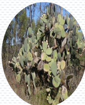
Nopal tapón Opuntia robusta APROBADA Densidad: 1 pza x 2 m 2