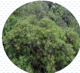
Siempre viva Sedum praealtum PROPUESTA Densidad: 1 pza x 1 m 2