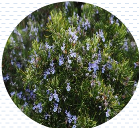
Romero Rosmarinus officinalis PROPUESTA Densidad: 12 pzas x 1 m 2