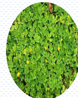
Cacahuatillo Arachis pintoi PROPUESTA Densidad: por semilla 1 gr x 1 m 2