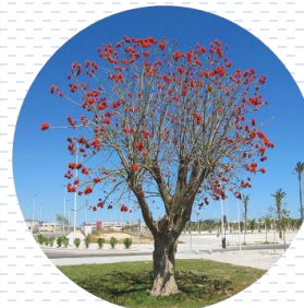
Colorín Erythrina americana APROBADA