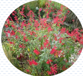
Mirto Salvia fulgens APROBADA Densidad: 16 pzas x 1 m 2