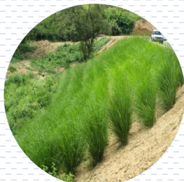
Vetiver Chrysopogon zizanioides PROPUESTA Densidad: 16 pzas x 1 m 2

Paleta vegetal | Estrato medio Vegetación para estabilización de talud