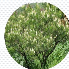
Palo azul Eysenhardtia polystachya APROBADA