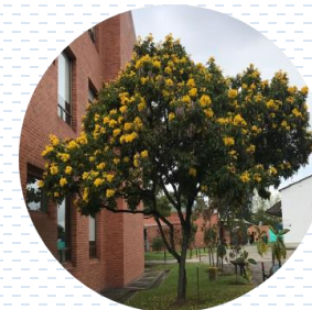
Tecoma Tecoma stans APROBADA