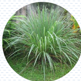
Té limón Cymbopogon citratus PROPUESTA Densidad: 6 pzas x 1 m 2