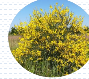
Retama Cytisus maderensis PROPUESTA Densidad: 1 pza x 1 m 2