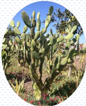
Nopal de San Gabriel Opuntia tomentosa APROBADA Densidad: 1 pza x 2 m 2

Paleta vegetal | Estrato bajo Cubresuelos