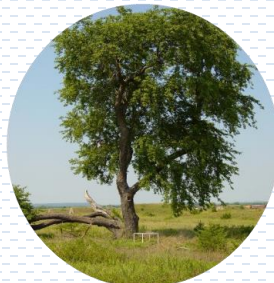
Capulín Prunus serótina APROBADA