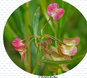
Chapulixtle Dodonaea viscosa APROBADA Densidad: 1 pza x 3 m 2