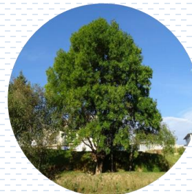
Fresno Fraxinus uhdei APROBADA