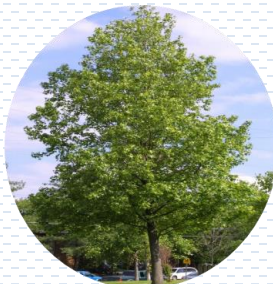
Liquidámbar Liquidambar styraciflua APROBADA