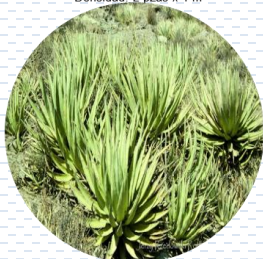
Agave Agave lechuguilla PROPUESTA Densidad: 3 pzas x 1 m 2