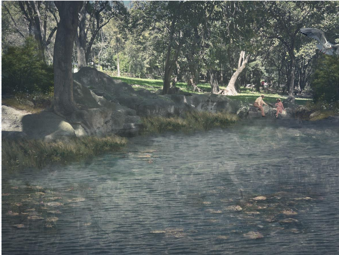
Plaza De Agua Las Tazas