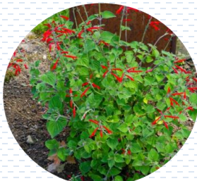
Hierba del burro Salvia elegans APROBADA Densidad: 16 pzas x 1 m 2

Paleta vegetal | Estrato medio Arbustos y herbáceas