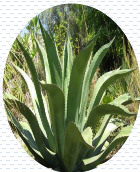
Maguey de pulque Agave salmiana APROBADA Densidad: 1 pza x 2 m 2

Paleta vegetal | Estrato medio Agaves y opuntias