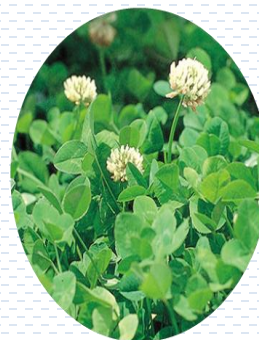
Trébol blanco Trifolium repens PROPUESTA Densidad: por semilla 0.6 gr x 1 m 2

Paleta vegetal | Estrato bajo Cubresuelos