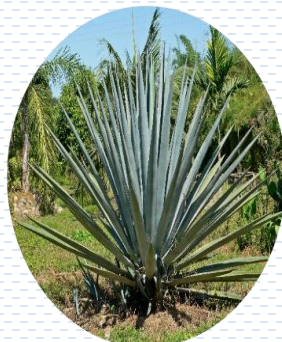
Agave azul Agave tequilana PROPUESTA Densidad: 1 pza x 2 m 2