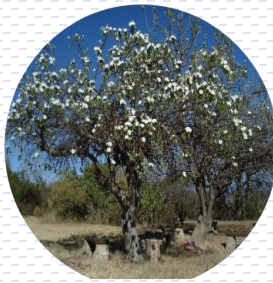
Cazahuate Ipomea murucoides APROBADA