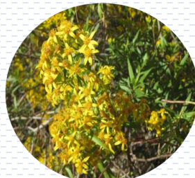
Jarilla Senecio salignus APROBADA Densidad: 1 pza x 2 m 2