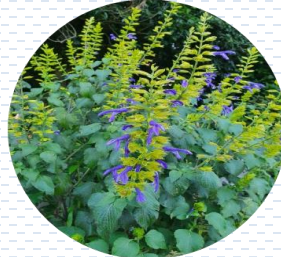
Tacote Salvia mexicana APROBADA Densidad: 16 pzas x 1 m 2