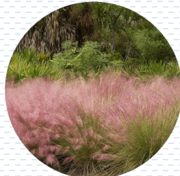
Pasto rosa Muhlenbergia capillaris PROPUESTA Densidad: 2 pzas x 1 m 2