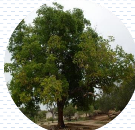
Encino Quercus rugosa APROBADA